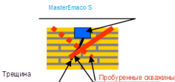
Рисунок 1 Примерная технология инъекции трещин.